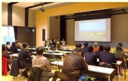
活動報告会の開催