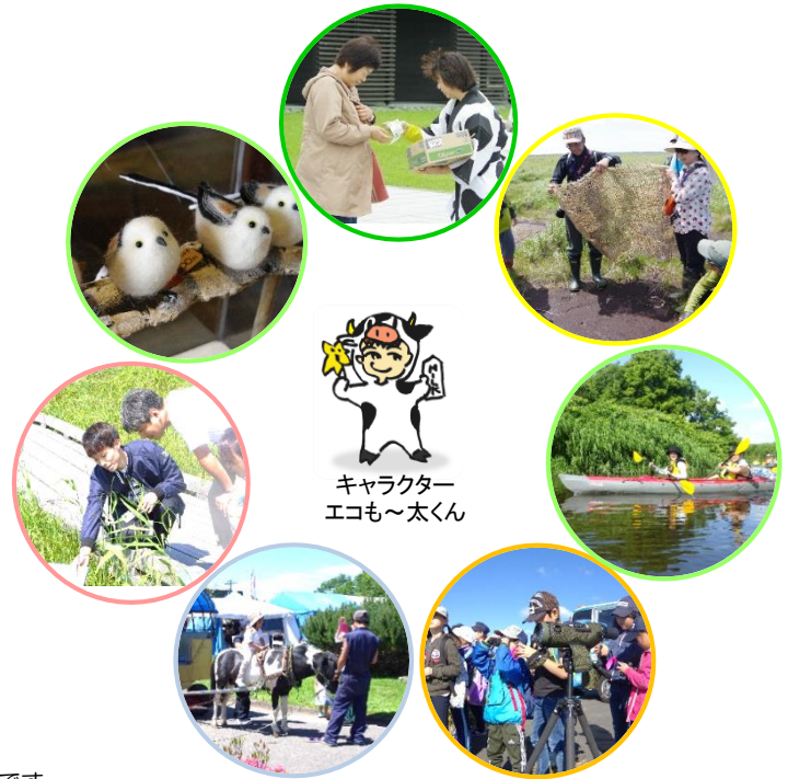
キャラクター エコモ〜太くん

エコモー☆サポーターは、プロジェクトの運営や、地域活動を進める方々の各種サポート（活動報告会の開催など）を行っています。