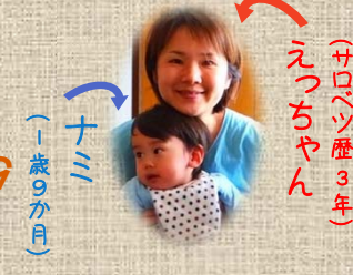
えつちゃん (サロベツ歴3年)