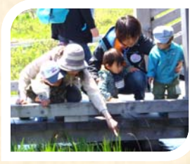
みんなと歩くと 発見がいっぱい!