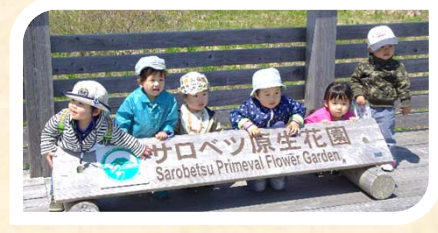
5月は11組の親子が集まりました。 今月も、みんなみんな集まれ~!