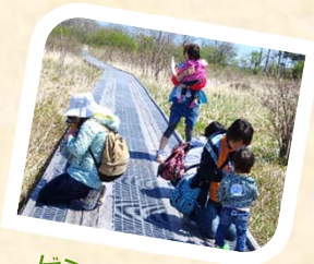
ビンゴをしながら 楽しく歩きましょう!