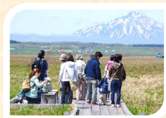
晴天なら利尻富士も すぐそこに!