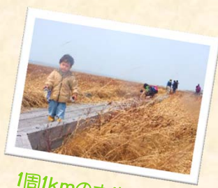
1周1kmの木道を歩くと お昼寝もグッスリ!!