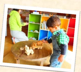
キッズコーナーでも 遊べるよ...♪

メンバー募集中!! わたしたちがご案内します!! サロベツでのびのび育てるママの会 参加申込・お問合せ先:サロベツ湿原センター tel:0162-82-3232 fax:0162-82-1009 Eメール: center@sarobetsu.or.jp