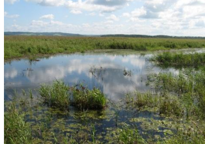
水路の埋め戻しによって再生した落合沼