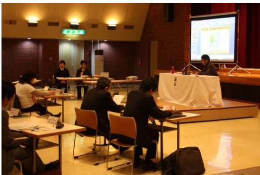
事務局からの報告

第13回上サロベツ自然再生協議会に引続き、第13回再生普及部会が開催されました。