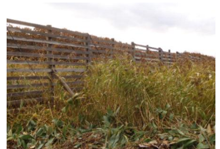
稚内砂丘内に設置されている堆雪柵